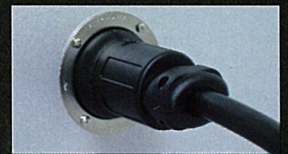
フランジコンセントとの接続状態