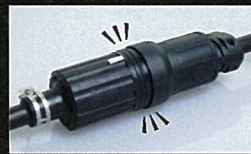
コードコネクタボディとの接続状態