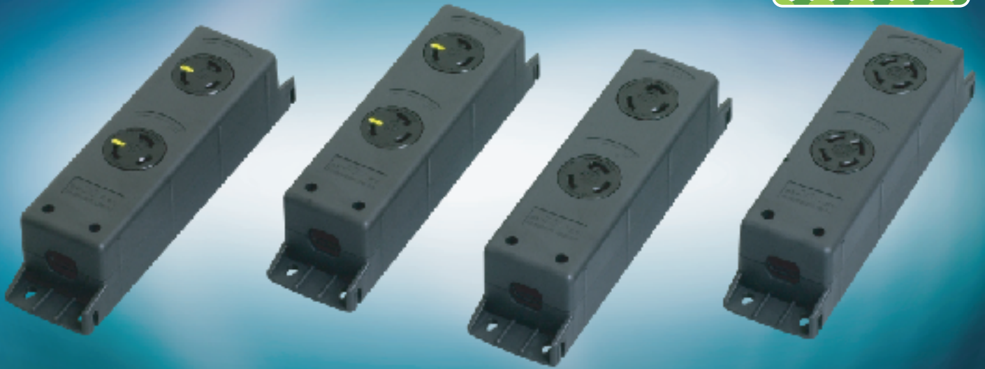
3313NT-L5 接地形2P 30A 125V (NEMA規格 L5-30準拠)